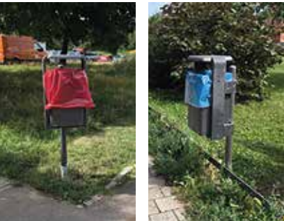
Umgesetzte und zusätzliche Abfallbehälter lassen dem Unrat keine Chance mehr. Weitere Behälter sind in der Planung.