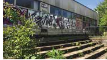
Solche Bilder von dem verfallenen Ortsteilzentrum, Johannesplatz-Treff, gehören bald der Vergangenheit an. Mit dem Abriss soll in diesem Winter begonnen werden.