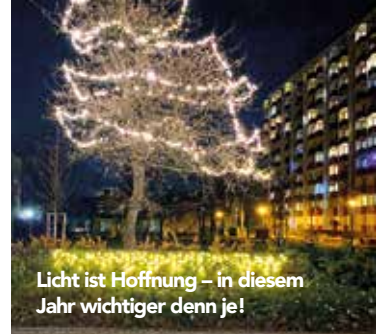
Licht ist Hoffnung – in diesem Jahr wichtiger denn je!