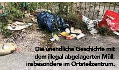
Die unendliche Geschichte mit dem illegal abgelagerten Müll, insbesondere im Ortsteilzentrum.