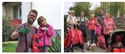
Einen Dank an die fleißigen Helfer:innen am „World Cleanup Day“, den 18. September. Nächstes Jahr zur selben Zeit wieder!