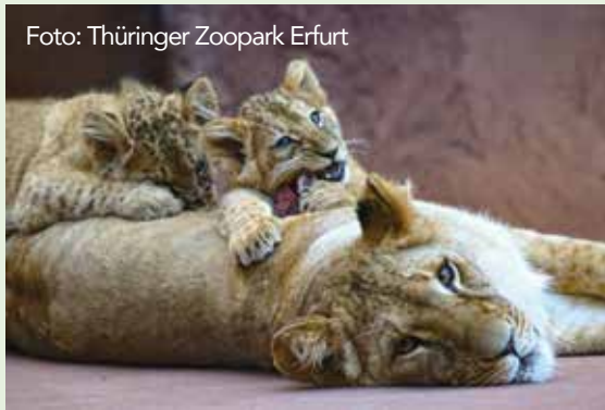
Der Zoo sorgt immer wieder für freudige Überraschungen in Sachen Nachwuchs.