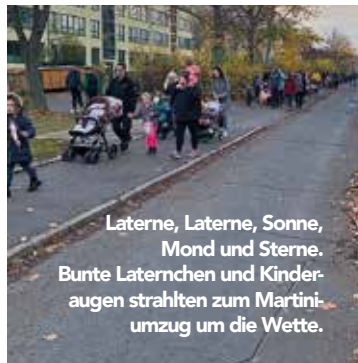
Laterne, Laterne, Sonne, Mond und Sterne. Bunte Laternen und Kinder- augen strahlten zum Martini- umzug um die Wette.