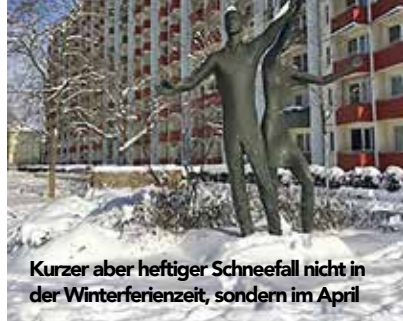
Kurzer aber heftiger Schneefall nicht in der Winterferienzeit, sondern im April