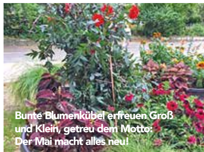
Bunte Blumenkübel erfreuen Groß und Klein, getreu dem Motto: Der Mai macht alles neu!