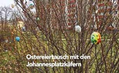
Ostereiertausch mit den Johannesplatzkägern