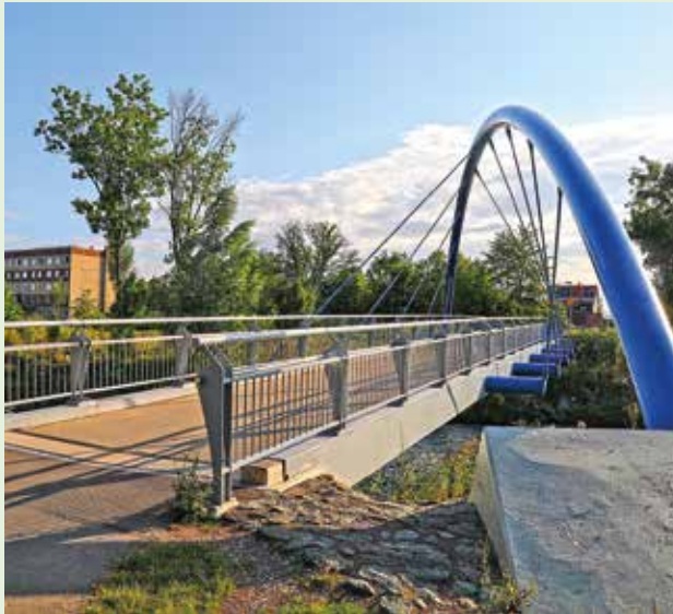
Fünf neue Brücken im Gisperslebener Kiliani-Park