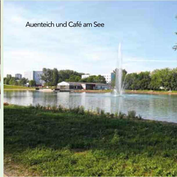
Auenteich und Café am See