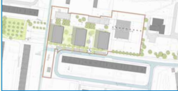
Pläne Sanierung des Ortsteilzentrums am Johannesplatz