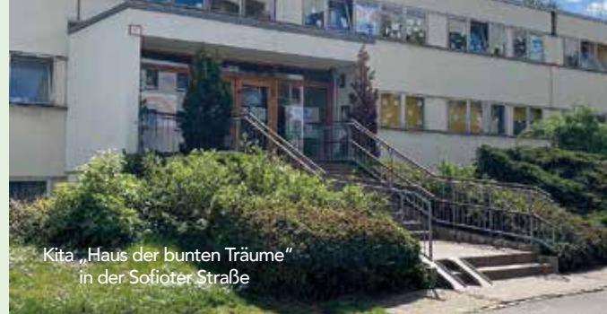
Kita „Haus der bunten Träume“ in der Sofioter Straße

Die Sanierung der Kindertagesstätte „Haus der bunten Träume“ (Kita 54) in der Sofioter Straße wird nun in Angriff genommen werden.