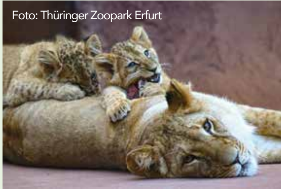
Der Zoo sorgt immer wieder für freudige Überraschungen in Sachen Nachwuchs.