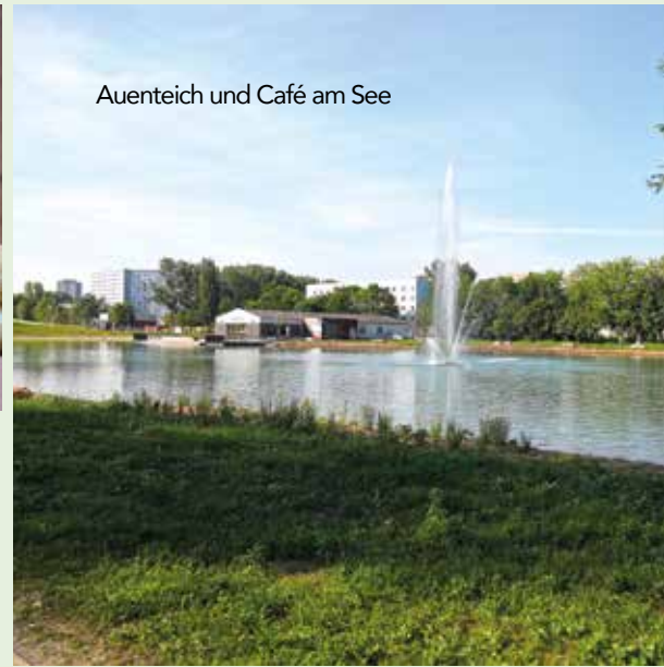
Auenteich und Café am See