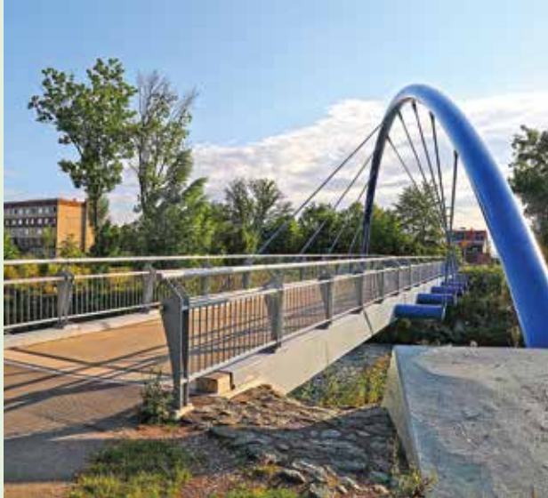
Fünf neue Brücken im Gisperslebener Kiliani-Park